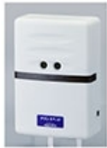
人感センサーを搭載する 本体ユニット

家族や介護者が本体ユニットの前を通過しても、認証キーを持つので、本体ユニットが関係者であることを識別。 受信機の音は鳴りません。